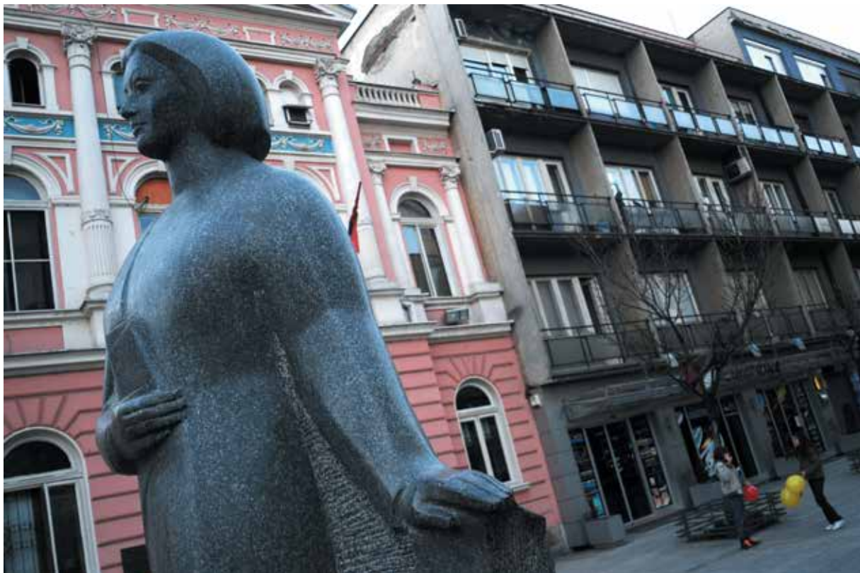
1990 Spomenik Desanki Maksimović, Valjevo, Srbija