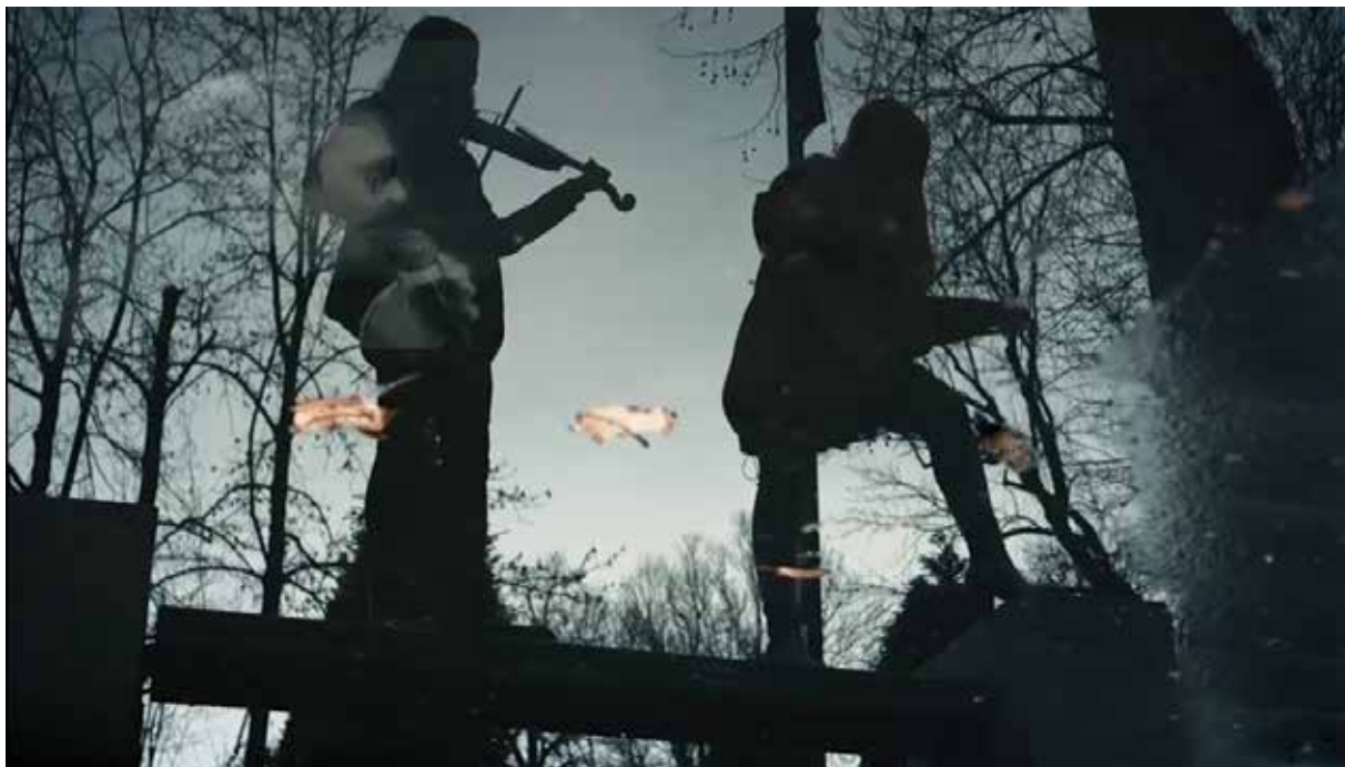
Kadar iz filma: INDEXI (DAVORIN) I MIRZA, JU Gimnazija Obala Sarajevo