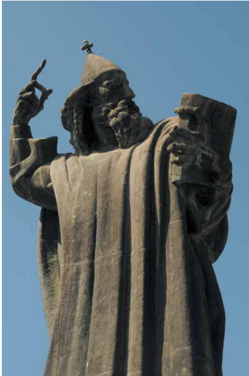
1929 Spomenik Grguru Ninskom, Split, Hrvatska