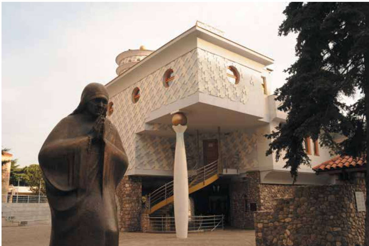
1999 Spomenik Majci Terezi, Skopje, Makedonija