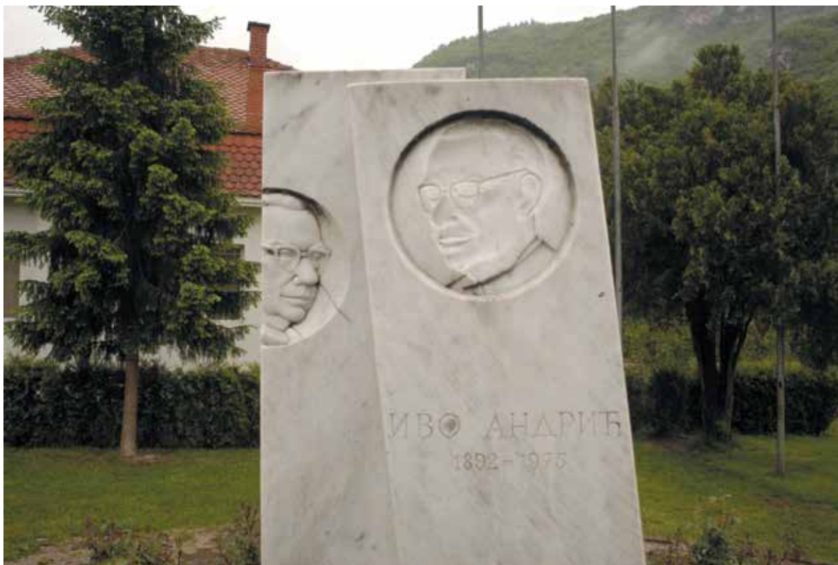
1994 'Krajputaš' – Spomenik Ivi Andriću, Višegrad, Bosna i Hercegovina